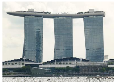
マリーナベイ・サンズ