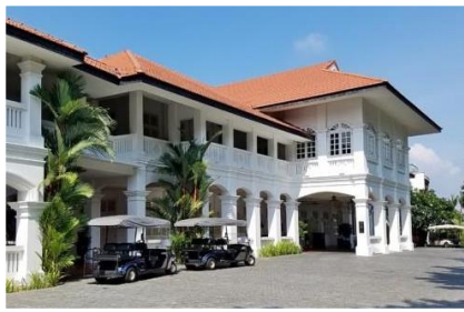
セントーサ島 カペラホテルシンガポール